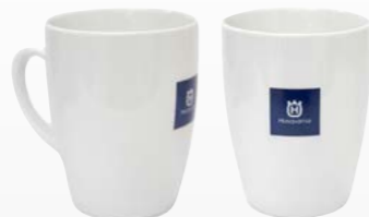
TAZA HUSQVARNA Caja 6 und. Ref: 18597492601 PVP 10,90 €