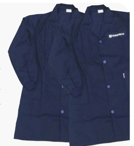
BATA HUSQVARNA S (46) / P (50) / M (54) / L (56) / XL (58) / XXL (62) / XXXL (66) Ref: 18HVBATATS/P/M/L/XL/XXL/XXXL PVP 19,90 €