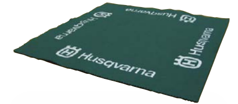
TAPETE unidad Ref: 18TAPETE PVP 2,00 €