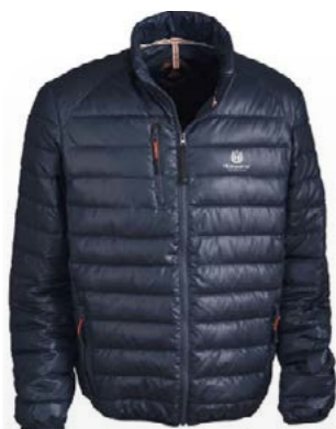
PLUMÍFERO SPORT Hombre S / M / L / XL / XXL / XXXL Ref: 18582228801/02/03/04/05/06 Mujer XS (34) / S (36) / M (38) / L (40) / XL (42) Ref: 18582228601 / 02/03/04/05 PVP 50,00 €