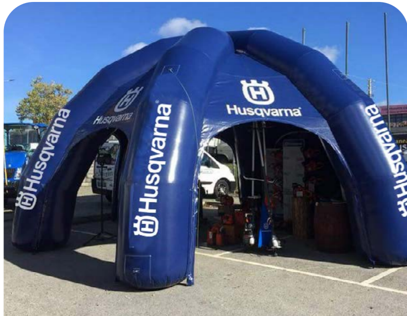
CARPA INFLABLE 8 M. Ref: 18101610400