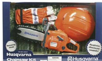
KIT MOTOSIERRA Con casco y guantes Husqvarna. Ref: 18586498201 PVP 14,90 €