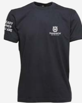
CAMISETA LOGO PEQUEÑO S / M / L / XL / XXL Ref: 18582324801 / 02 / 03 / 04 / 05 PVP 5,90 €