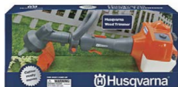
RECORTADORA Recortadora a pilas. Con luces y giro real. Ref: 18586498101 PVP 14,90 €