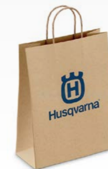
BOLSA HUSQVARNA DE PAPEL Tamaño 32 x 42 cm Ref: 18582196504 PVP 0,19 €