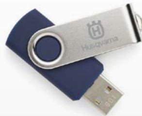
MEMORIA USB 1 GB / 4 GB Ref: 18510018301 / 18522627301 PVP 4,90 € / 5,90 €