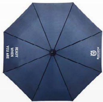
PARAGUAS Ref: 18101691990 PVP 5,90 €