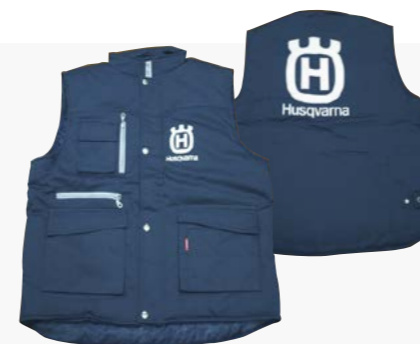
CHALECO MULTIBOLSILLO XS / S / M / L / XL / XXL / XXXL Ref: 1801443XS / S / M / L / XL / XXL / XXXL PVP 15,90 €