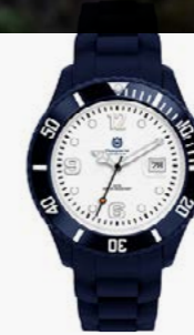
RELOJ SPORT Ref: 18582403701 PVP 9,90 €