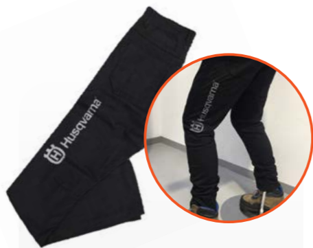
PANTALÓN HVA WORK 38 / 40 / 42 / 44 / 46 / 48 Ref: 1816241238/40/42/44/46/48 PVP 25,65 €