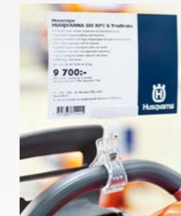
PINZA PORTAPRECIOS Con portaprecios A6 para máquina Ref: 180320150410 PVP 1,90 € PVP subv. 0,90 €