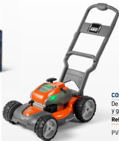
CORTACESPED De plástico a pilas, con luces y giro real Ref: 18582406301 PVP 25,90 €