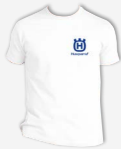
CAMISETA BLANCA S / M / L / XL / XXL Ref: 18HVCMSLZBS / M / L / XL / XXL PVP 5,00 €