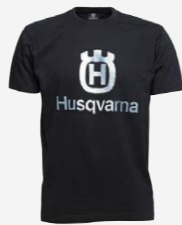
CAMISETA LOGO GRANDE S / M / L / XL / XXL / XXXL Ref: 181016371 / 48 / 50 / 52 / 54 / 56 PVP 5,00 €