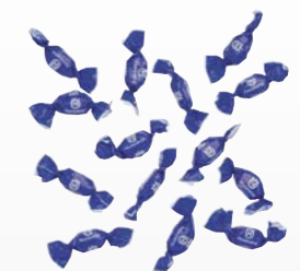
CARAMELOS HVA 1 kg. Ref: 18101692098 PVP 6,90 €