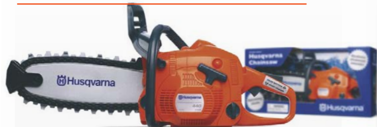
MOTOSIERRA Un divertido juguete para los más pequeños. Ref: 18522771101 PVP 11,00 €