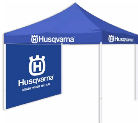
CARPA HUSQVARNA Medida 3x3 m Ref: 18101610296 PVP 655,00 € PVP subv. 490,00 €