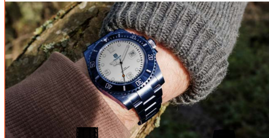
RELOJ CHRONO Ref: 18582406401 PVP 54,90 €