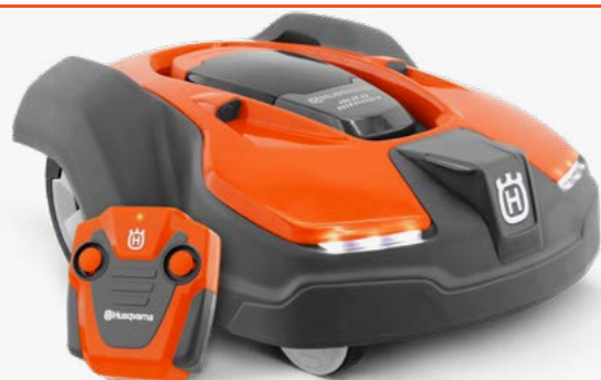
AUTOMOWER® TELEDIRIGIDO Con control teledirigido, sonido y luces LED, características que lo convierten en el juguete perfecto para los más pequeños de la casa. Su mando permite conducir el robot en cualquier dirección y girarlo en todos los sentidos. Ref: 18597809601 PVP 39,00 €