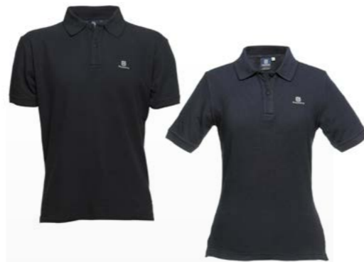
POLO CLÁSICO HUSQVARNA Hombre S / M / L / XL / XXL / XXXL Ref: 18101638048 / 50 / 52 / 54 / 56 / 58 Mujer XS / S / M / L / XL Ref: 18101637946 / 48 / 50 / 52 / 54 PVP 18,90 €