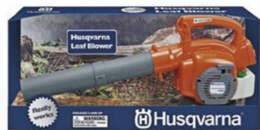
SOPLADOR De plástico a pilas. ¡Funciona de verdad! Ref: 18586498001 PVP 14,90 €