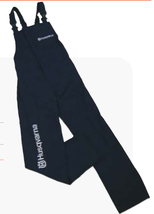
PETO HUSQVARNA S(50) / P(52) / M(54) / L(56) / XL(58) / XXL(62) / XXXL(66) Ref: 18HVPETOTS/P/M/L/XL/XXL/XXXL PVP 17,90 €