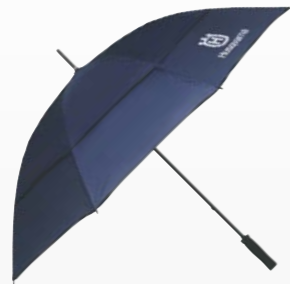
PARAGUAS GOLF Ref: 18101692020 PVP 8,50 €