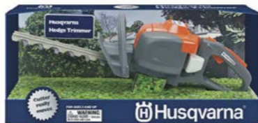
CORTASETOS Divertido juguete. Emite sonido y genera movimiento. Ref: 18586497901 PVP 14,90 €