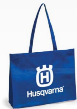
BOLSA AZUL DE TEJIDO Ref: 18582196503 PVP 0,60 €