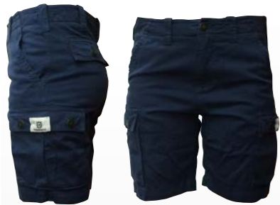
BERMUDAS S / M / L / XL Ref: 1817241238/40/42/44/46/48/50 PVP 39,00 €