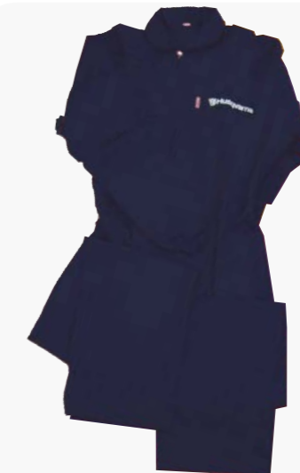
FUNDA HUSQVARNA S (46) / P (50) / M (54) / L (56) / XL (58) / XXL (62) / XXXL (66) Ref: 18HVFUNDTS/P/M/L/XL/XXL/XXXL PVP 26,90 €