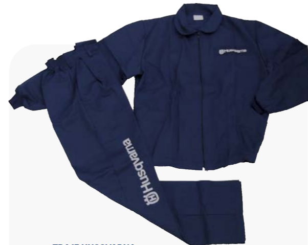
TRAJE HUSQVARNA S (46) / P (50) / M (54) / L (56) / XL (58) / XXL (62) / XXXL (66) Ref: 18HVTRAJTS/P/M/L/XL/XXL/XXXL PVP 26,90 €

Estos artículos no están sujetos a descuentos ni entran en el porcentaje anual de apoyo por gasto publicitario.