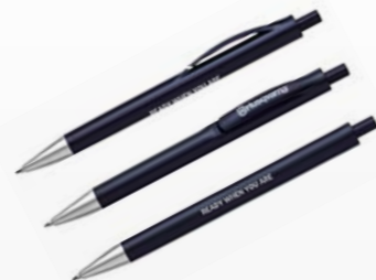
BOLÍGRAFO RWYA Ref: 18582391901 PVP 0,25 €