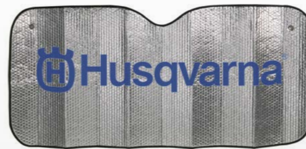
PARASOL ALUMINIO 130 x 60 cm Ref: 18016024 PVP 2,50 €