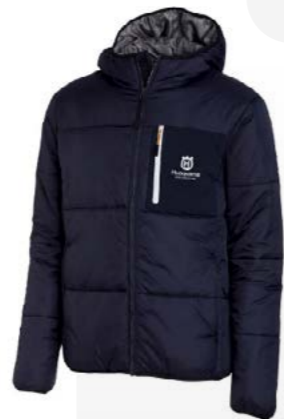
PLUMÍFERO WINTER Hombre S / M / L / XL / XXL / XXXL Ref: 1858227301/02/03/04/05/06 Mujer XS (34) / S (36) / M (38) / L (40) / XL (42) Ref: 1858229101/02/03/04/05 PVP 50,00 €